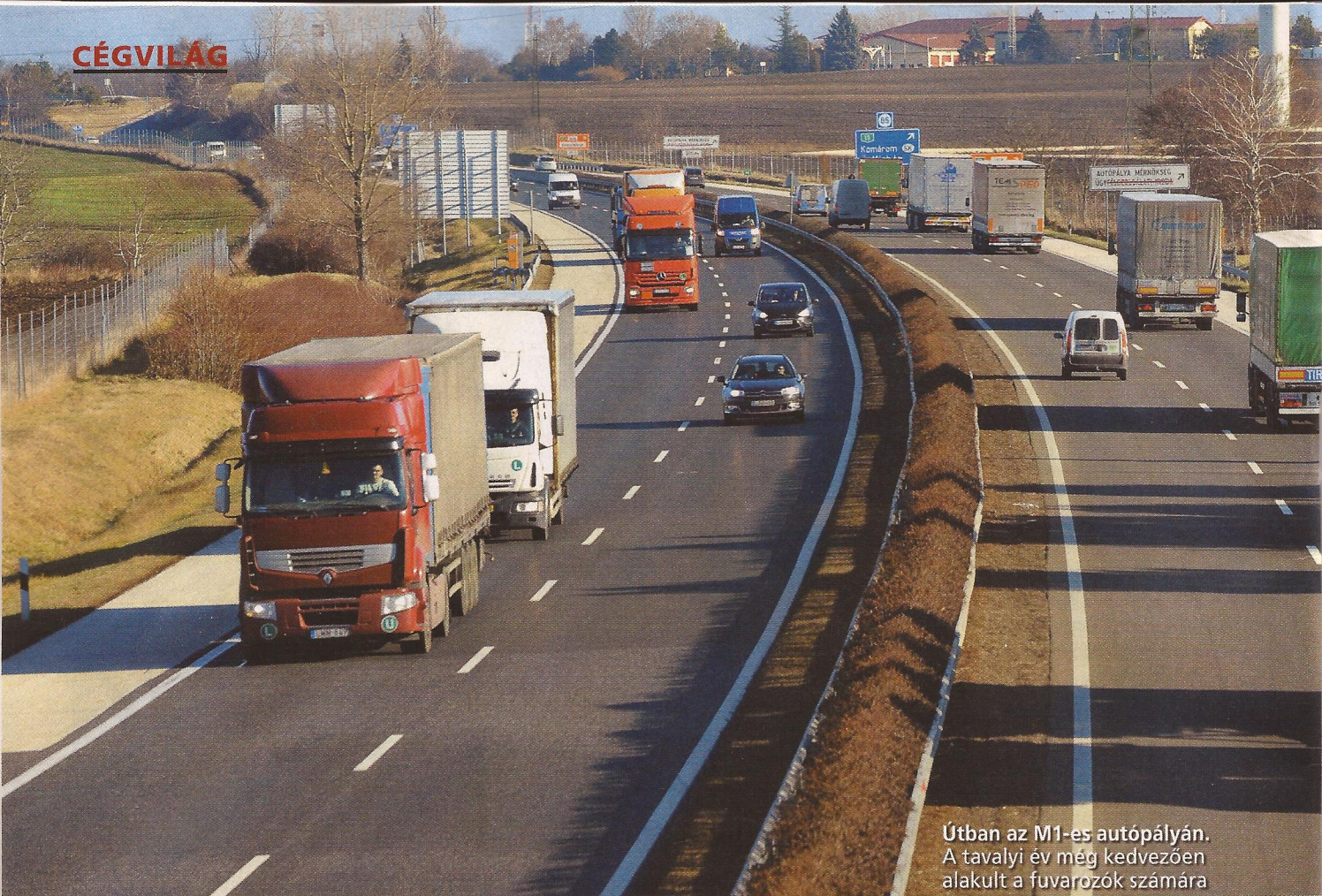
Útban az M1-es autópályán. A tavalyi év még kedvezően alakult a fuvarozók számára